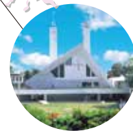
泽维尔纪念大教堂 (10分钟)