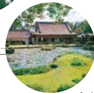
常永寺雪州庭园 (15分钟)