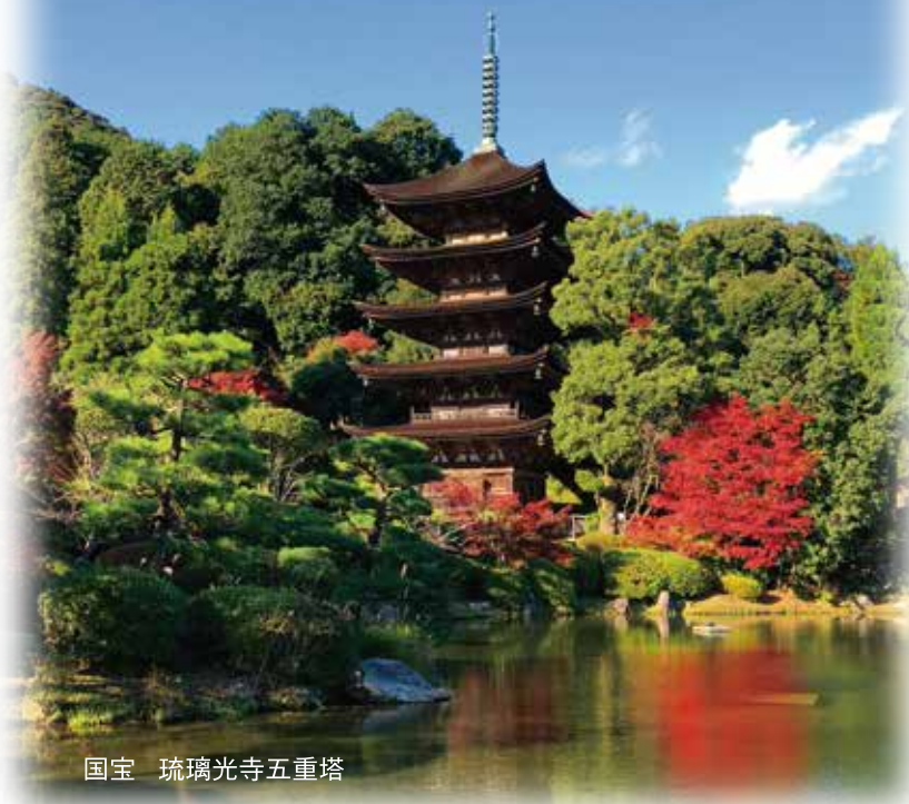
国宝 琉璃光寺五重塔

琉璃光寺的五层宝塔正在对柏树皮屋顶进行约70年来的首次彻底翻修 (计划于2026年3月完成)