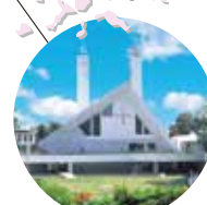
자비에르 기념 대성당 (10분)